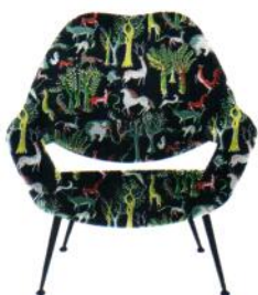
1/ Fauteuil Ciel ! de Noé Duchaufour-Lawrance (Tabisso). 2/ Radiateur de Samy Rio © SAMY RIO. 3/ Table basse/bout de canapé 621 de Dieter Rams (Vitsoe) © VITSOE.